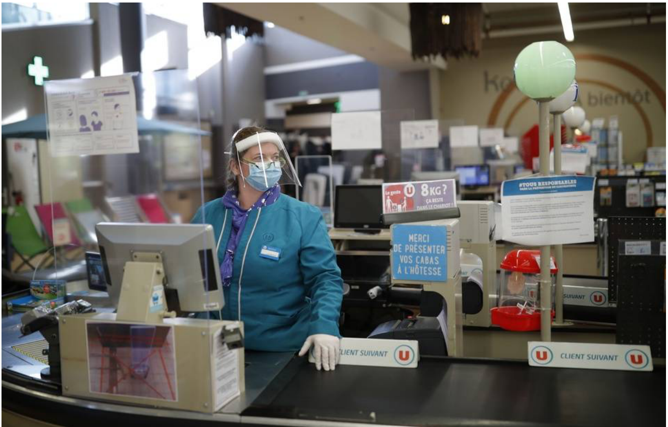
Une caissière d'un supermarché de Saint-Pol-de-Léon (Finistère) lors de la visite d'Emmanuel Macron, le 22 avril 2020.