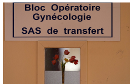
Face aux demandes de stérilisation des femmes, le dilemme des médecins