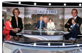
Présidentielle 2022 : un débat tendu entre Valérie Pécresse et Éric Zemmour