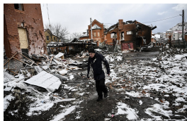
Guerre en Ukraine, 15e jour : les chars russes aux portes de Kiev, des couloirs humanitaires quotidiens annoncés par Moscou