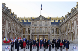
À Versailles, les Européens face à la guerre en Ukraine