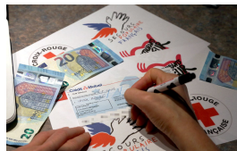
Aides à l'Ukraine : pourquoi les associations plébiscitent les dons en argent