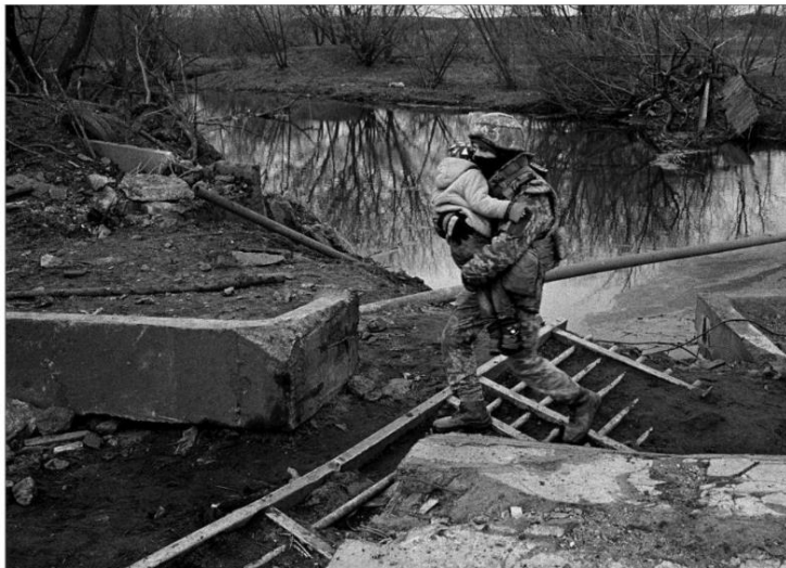
Le photographe Alexander Glyadyelov a documenté l'évacuation des civils sous le feu constant des troupes russes à Irpin, au mois de mars. Pour lui, « seule la photographie permet encore de parler franchement de la vie ».

Les images de la guerre s'inscrivent dans une guerre des images dont les enjeux sont cruciaux. « Les photographes sont en quelque sorte des géopoliticiens en images », souligne la conservatrice Sylvie Le Ray-Burini, l'un des commissaires