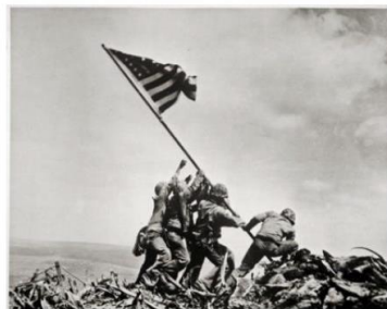
Photo de Joe Rosenthal prise pendant la bataille d'Iwo Jima, au Japon. Seconde Guerre mondiale, 23 février 1945.

Les débuts... en Ukraine. Aux alentours de 1850, les pionniers se heurtent à l'impossible : comment saisir une explosion avec un temps de pause de quarante secondes ? Ils y parviennent, au siège de Sébastopol de 1855. Le grand port de Crimée (actuellement territoire de l'Ukraine annexé par la Russie) soutenait déjà un siège. L'Empire russe veut déjà s'agrandir et lutte contre l'Empire ottoman. Les Français et les Britanniques, craignant une extension du conflit, attaquent la flotte russe à Sébastopol. On ne photographie alors pas les morts ni les blessés.