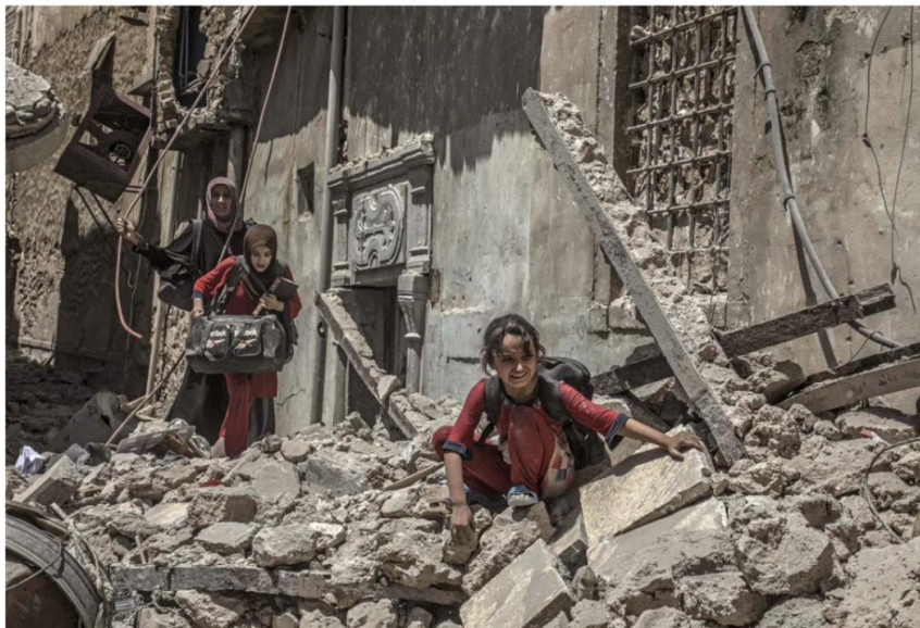
« La Bataille de Mossoul », de Laurent Van der Stockt, guerre d'Irak, 29 juin 2017.