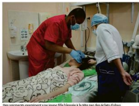
Des soignants examinent une jeune fille blessée à la tête par des obus d'artillerie.