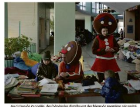
Un cirque de Zaporizhzhia, des bénévoles distribuent des bonbons de première nécessité.