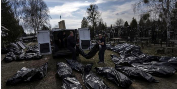
Au cimetière de Boutcha, jeudi 7 avril 2022. Les dépouilles de plusieurs dizaines de civils tués ces dernières semaines.

Derrière le choc des images de Boutcha, comme dans d'autres villes ukrainiennes, il faut tenter d'approcher de la vérité, de déterminer les culpabilités. Un long processus d'investigation mené au niveau international, qui a été activé rapidement sur le conflit ukrainien.