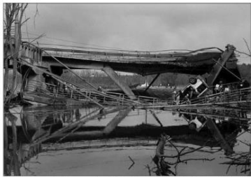
À Irpin, au mois de mars, les civils fuient les bombardements dont la ville porte les stigmates, et qu'Alexander Glyadyelov a immortalisés.

de l'exposition « Photographies en guerre », présentée au Musée de l'Armée, à Paris (voir ci-contre).