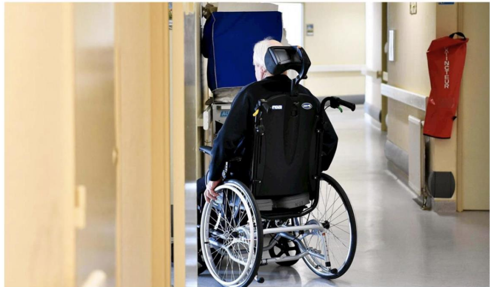
Une enquête a été menée au siège d'Orpea et au sein de dix de ses Ehpad, selon les détails donnés par le gouvernement (Illustration).

Il y a eu des manquements sur le plan humain et organisationnel BRIGITTE BOURGUIGNON, MINISTRE DÉLÉGUÉE À L'AUTONOMIE