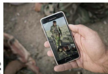
Philippe de Poulpiquet a réalisé cette photo à Khazir, pendant la guerre d'Irak, en 2016.

■ « Photographies en guerre », musée de l'Armée aux Invalides (Paris VII), du 6 avril au 24 juillet, de 10 heures à 18 heures tous les jours, 21 heures le mardi, 11-14 €.