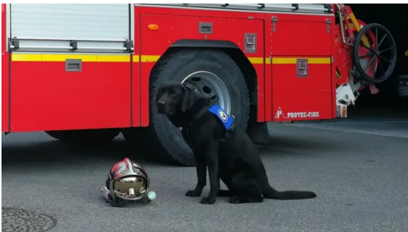
Le chien "Loi" accompagne les victimes dans la juridiction de Cahors depuis le printemps 2019.

En France, plusieurs juridictions expérimentent le chien d'assistance judiciaire, qui accompagne les victimes tout au long de la procédure. L'animal aide à mettre en confiance, notamment