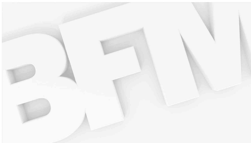
Ouchi, le chien d'assistance judiciaire à Nevers.

Le chien accompagne également les victimes lors de leur déplacement à l'unité médico-judiciaire, une étape éprouvante de la procédure. "L'apaisement est particulièrement notable dans ces moments difficiles, où sont abordées des questions très sensibles ou bien lors d'examens délicats", note Jérôme Moreau.